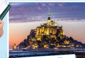
MONT SAINT MICHEL

Viện Pháp tại Việt Nam luôn đồng hành cùng bạn!