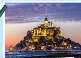
LẦU ĐÀI MONT SAINT MICHEL

Viện Pháp tại Việt Nam luôn đồng hành cùng bạn!