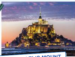
SAINT MICHAEL'S MOUNT

Viện Pháp tại Việt Nam luôn đồng hành cùng bạn!