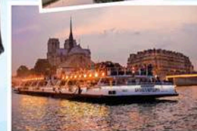
DU THUYỀN TRÊN SÔNG SEINE