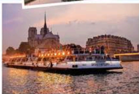
SEINE RIVER BOATS